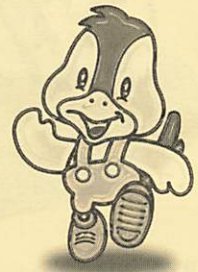
阿知須町イメージキャラクター 「コッコちゃん」