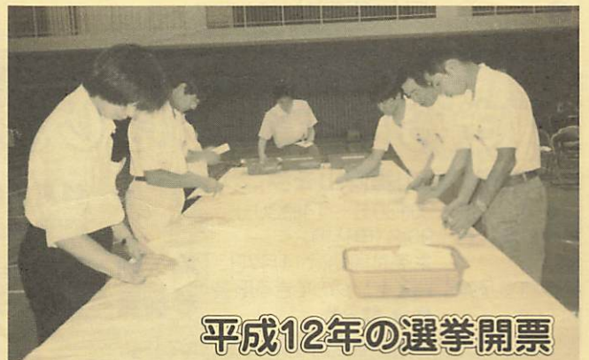
平成12年の選挙開票