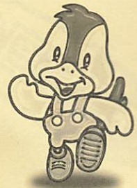
阿知須町イメージキャラクター 「コッコちゃん」