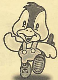
阿知須町イメージキャラクター 「コッコちゃん」