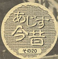
昭和45年頃の御米橋

上は、昭和45年頃の御米橋（ごまいばし）改修工事の写真です。御米橋は、昭和3年にコンクリート造で架設されましたが、幅員が4mと狭く自転車で通行中の中学生が事故にあったり、大型車両が通るたびに反対側の車は橋の手前で待っている状況でした。そこで現在の橋（下の写真）が、昭和45年4月に延長約30m、幅員9m（うち歩道1.5m）の鉄骨造で完成し、町役場前（当時の国道190号線）の通行がスムーズになりました。