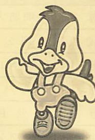
阿知須町イメージキャラクター 「コッコちゃん」