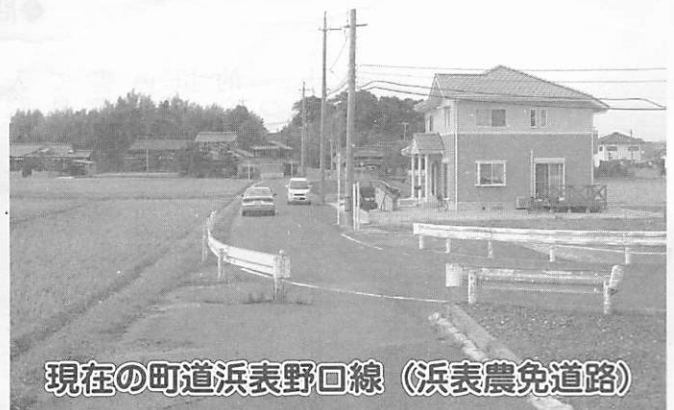
現在の町道浜表野口線（浜表農免道路）