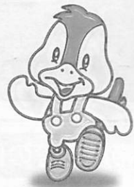
阿知須町イメージキャラクター 「コッコちゃん」