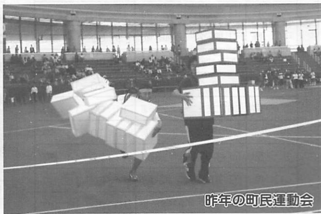
昨年の町民運動会