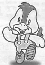
阿知須町イメージキャラクター「コッコちゃん」