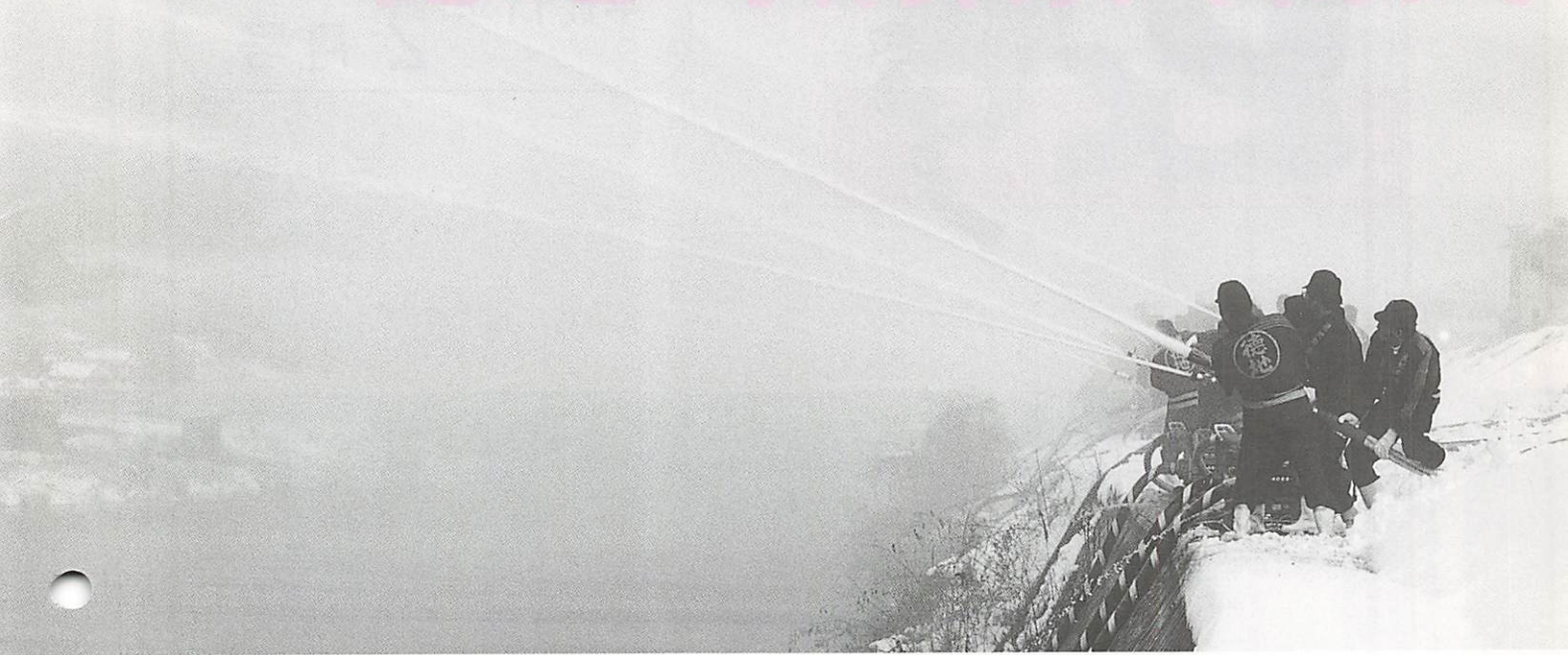
佐波川堤防での一斉放水

1月10日、新春を飾る徳地町消防出初式が、消防団員、消防署員、河内婦人消防クラブ員ら総勢2百30名が参加し、盛大に挙行されました。