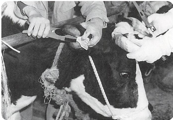
▲町内の牛に耳標（じひょう）を装着

今までは、それぞれの農家や団体が独自の番号などで管理していました。このシステムでは、番号を一本化するので、個体の確認が確実に簡単になり、取り違えがなくなります。また、伝染病発生時に瞬時に牛の移動状況がわかり、迅速な防疫対策をすることができます。