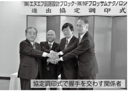
協定調印式で握手を交わす関係者

の交通環境の良さから生産拠点を山口市に集約することに決めた。県や市の発展にも協力していきたい」と述べられ、市長は、「新たな事業所進出により、地域雇用の創出や本市の地方創生の取り組みにも大きくご貢献いただけるものと期待している」と述べました。