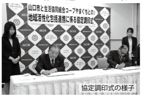
協定調印式の様子

本市と生活協同組合コープやまぐちは、これまで見守り活動や災害時の対応等で連携して取り組んできていますが、今後より一層密接な連携と協力をし、地域の活性化や市民サービスの向上を