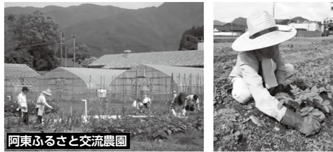
阿東ふるさと交流農園