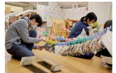
洗浄した写真を1枚1枚丁寧に乾かしている様子。活動のためには広い場所も必要です。