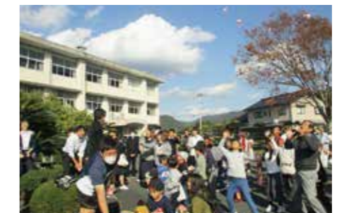
押しつけではなく、助け合いのもと、自主的な活動がしやすい環境づくりをしている。