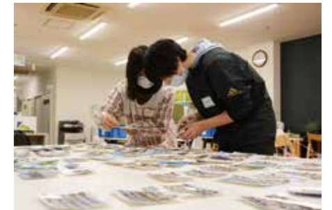
仕分けの様子。たくさんの写真を前にも頑張れるのは、持ち主の気持ちが見えるから。

こうしたつながりを生かして、今後は災害の記憶が風化しないよう、啓発などの取り組みに力を入れています。思いのある方の参加をお待ちしています。