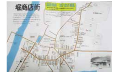
記憶を辿って作成した昭和30年代の徳地堀地域のマップ。高齢者に大好評。地域で話題に。

各団体が個々に活動するのではなく協力し合い、市民・地域が主体となってまちを活性化するための活動ができれば、もっと明るく豊かな地域になると思います。活動に興味がある方の参加をお待ちしています。