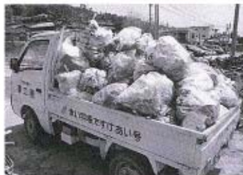
〈写真右〉防波堤の石の隙間にたくさんさんのゴミを発見 〈写真上〉約1時間の作業で軽トラック1車分のゴミが集まりました