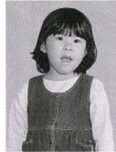
大中のどかちゃん(浜中)