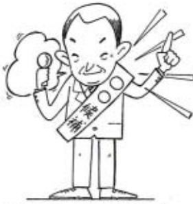
ルールを守った明るい選挙運動。

●事前運動 選挙運動は、選挙運動期間中しかできません。ですから、立候補届出前のすべての選挙運動は禁止されています。 ●戸別訪問 各戸を訪問して、投票の依頼をすることはできません。ただし、路上や電車の中などで偶然出会った場合や、電