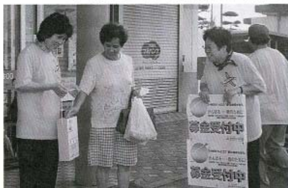
募金活動場所 ショッピングセンター トーク 丸久秋穂店 道の駅あいお ボプラ秋穂店 大海総合センター