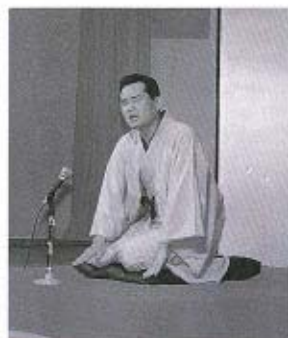
●春風亭正朝の落語