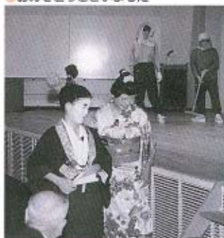
●楽しかった慰安演芸