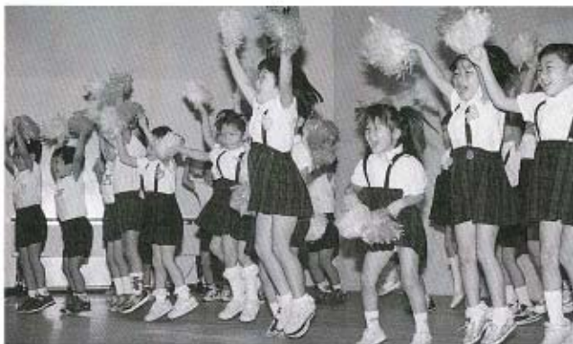
●保育園児のリズム遊び

慰安演芸では、保育園児のリズム遊びや落語、寸劇などが披露され、会場は高らかな笑い声に包まれました。 21世紀を目前に控えて、秋穂町でも高齢化が急速に進んでおり、高齢化率も遂に25%を超え、高齢化福祉の充実が特に重要な課題となっております。 町民の誰もが健康で安心して、生きがいのある生活を送ることのできる豊かな長寿社会をつくるためには、町民1人ひとりが高齢者の問題を身近なことから関心と理解を深め、家庭、地域社会、職場、学校などの連携のもと、助け合ってすばらしい21世紀を迎えたいものです。