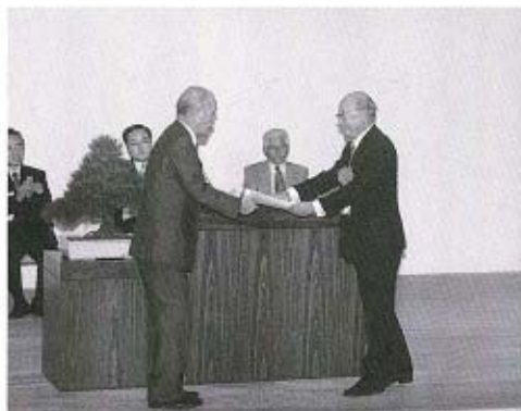
●おめでとうございます