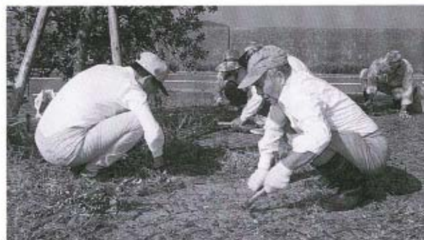
●おざおん公園にて