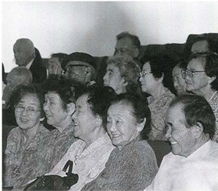
笑顔があふれた会場

9月15日の敬老の日、大海総合センターで秋穂町の敬老行事、第34回社会福祉大会が行われました。 当日会場には、町内から多数の元気なお年寄りが集まり互いの長寿を祝いました。