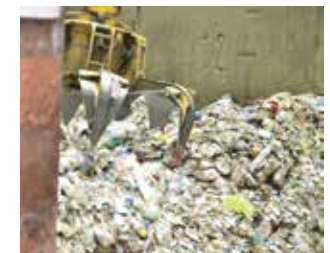
焼却するごみを集める場所「ごみピット」の様子

この経費の内訳をみると、可燃ごみの焼却が約13億円が一番多く、次いでごみ収集の経費が約10億円となっています。