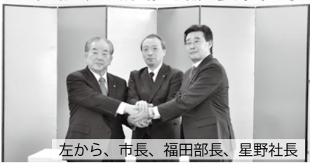
左から、市長、福田部長、星野社長