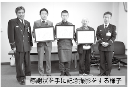
感謝状を手に記念撮影をする様子

表彰された3人は、昨年12月29日(日)、道場前前の「ここと」どうもん店内において60歳代男性が急に倒れた際、119番通報および胸骨圧迫、AEDの使用による救命処置を連携して実施し、救急隊に引き継ぎました。3人の連携と的確な行動により、倒れた男性は一命を取り留め、現在は社会復帰をされています。