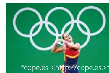
*cope.es <http://cope.es> リディア・バレンティン選手(重量上げ)

いよいよ東京2020オリンピック・パラリンピックが近づいてきました。日本やスペイン代表にもぜひ活躍してほしいですね。山口で事前合宿を実施している水泳スペイン代表チームには実力のある選手がたくさんいますが、水泳だけではなく他の競技でも活躍が期待されています。特に、バスケットボールのスペイン男子チーム(リオ2016年大会で銅メダル)や女子チーム(同大会で銀メダル)、ハンドボールの男子チーム(2018年・欧州優勝)や、射撃でもスペイン代表は猛者として世界各国の選手に警戒されています。また、個人種目でも、