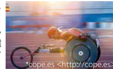
*cope.es <http://cope.es> 活躍が期待されるエバ・モラル選手(パラトライアスロン)

メダル獲得が予想されています。スペイン選手団旗手候補のサウル・クラビオット(カヌー)、ミレイア・ベルモンテ(競泳)、リディア・バレンティン(重量上げ)をはじめ、カロリナ・マリン選手(バドミントン)やラファエル・ナダル選手(テニス)などの活躍に注目が集まっています。それから、リオ大会で31個のメダルを獲得したスペイン代表のパラリンピックチームも見逃せません。体力と精神力が物をいうとされるトライアスロン競技では交通事故から立ち直ったエバ・モラル選手がスペインパラチームを引っ張っていくでしょう。日本はもちろん、スペインの選手もぜひ応援してくださいね!