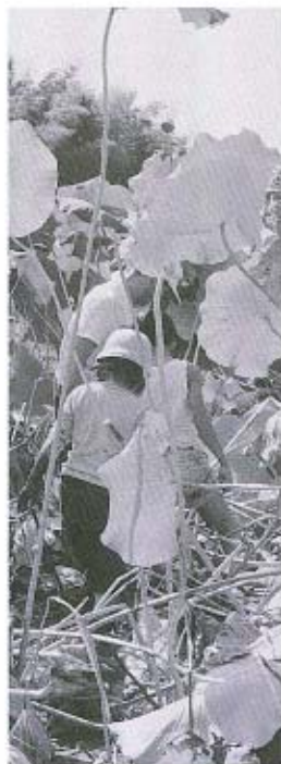
レンコン、あったぞ

10月7日(日)、天田地区のハス田でハス掘りを行いました。当日は30人近い参加者があり、中に埋まっているお宝を手探り・足探りで見つけ、泥まみれになりながら掘り出していました。レンコンを掘り終わったあとは、食推さんによるとりたてのレンコン料理をみんなでおいしくいただきました。