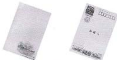
「絵入りはがき関門海峡」 「無地」

平成14年用お年玉付き年賀はがきを、11月1日(木)から発売します。絵入りはがきは、今回から地方版一種類のみとなります。