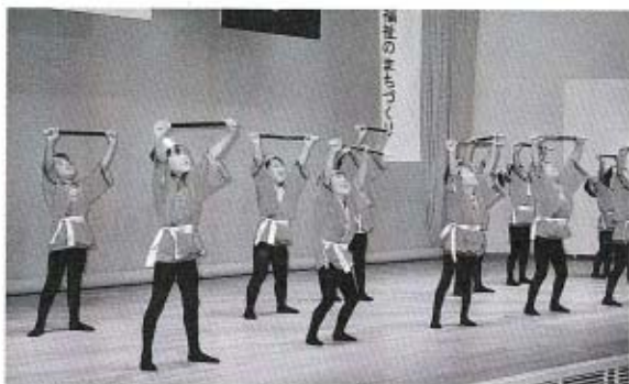
▲大海保育園の園児による劇「あっぱれ孫悟空」。小さくても元気いっぱいの子孫悟空たちが舞台せましと飛び回りました。

9月15日の敬老の日、大海総合センターで、秋穂町敬老行事第35回秋穂町社会福祉大会が行われました。 21世紀を迎えて、秋穂町でも高齢化が急速に進んでいます。高齢化率も27%近くになり、高齢者福祉の充実が特に重要な課題となっています。 今年の社会福祉大会は、このような中で町民だれもが健康で、安心して生きがいのある生活を送ることのできる豊かな長寿社会をつくるため、町民一人ひとりが高齢者の問題を身近なこととして関心と理解を深め、家庭、地域社会、職場、学校などの連携のもと、あらゆる場面での取り組みを進めていくことの必要