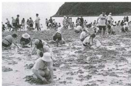
▲あたり一面、盛りかえされた干潟に参加者の気持が伝わってきます。