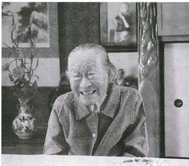
▲いつもすてきな笑顔。これからもこの笑顔でいてください。