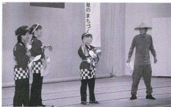
▲福祉団体の皆さんによる介護予防事業についての劇。むずかしい話を面白おかしく、お年寄りにも分かり易い劇に仕上げてみました。