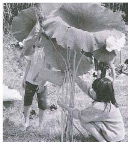
大きな傘ができました