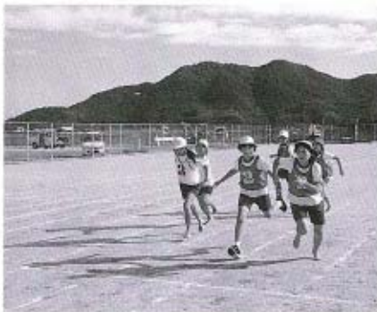
▲バトンタッチは、リレーの勝敗を分ける重要なカギです。