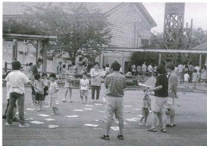
▲大勢の参加のあった、今回の秋まつり。大人も子どももいっしょになって、とても楽しそうです。

なれない手つきで、子どもも心配そう。「ほくのほうが上手くできるよ」と言っている声が聞こえてきました。