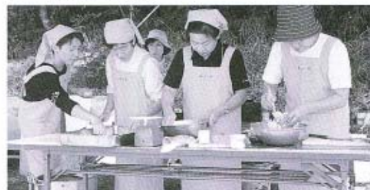
とれたてのレンコンを使って