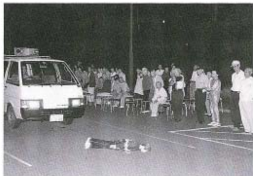
▲予想以上のダミー人形の衝撃にみんなビックリです。

体験学習では、ダミー人形を使った衝突実験や、夜間の視認性の実験、反射材の効果実験な