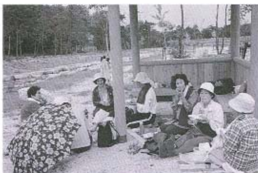
▲運動したあとの、食事の味は、格別です。

時折小雨の降るあいにくの曇り空、10月8日(月)、体育の日、秋穂町歴史民俗資料館に集まった人は約1500人。ここから、千坊川砂防公園(外屋池の上)まで、豊かな自然の中を歩いて、楽しい1日を過ごそうという企画、その名も「健康ウォーク大会」が、今年も盛大に開催されました。 参加者は、往復約8km、片道1時間の道のりを3~5人のグループで、健康や環境に関するクイズやゲームをしながら楽しく歩きました。