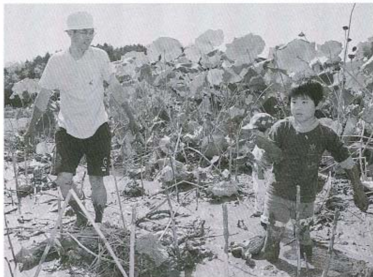
大きなレンコン見つけたね

10月7日(日)、天田地区のハス田でハス掘りを行いました。当日は30人近い参加者があり、中に埋まっているお宝を手探り・足探りで見つけ、泥まみれになりながら掘り出していました。レンコンを掘り終わったあとは、食推さんによるとりたてのレンコン料理をみんなでおいしくいただきました。