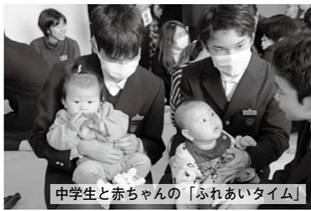
中学生と赤ちゃんの「ふれあいタイム」