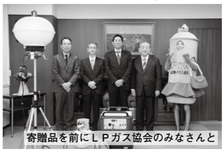
寄贈品を前にLPガス協会のみなさんと

贈呈を受けた市長は、「LPガス発電機をはじめ、災害時や防災訓練等に活用できる物品を寄贈いただき、誠にありがたい。LPガスは、他のエネルギーと比べ