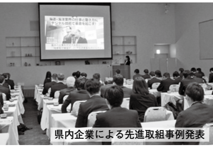
県内企業による先進取組事例発表

には、山口市内および近郊に所在する企業のトップなどが数多く出席し、内閣官房の成長戦略や県内企業の先進取り組み事例などに耳を傾けるとともに、様々な業種の参加者同士で情報交換を行い、交流を深めました。