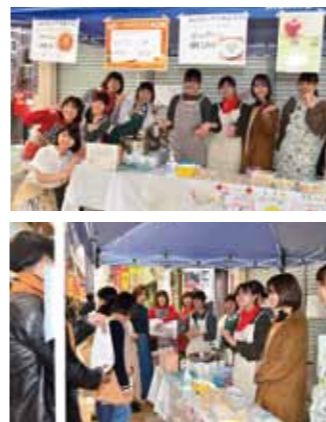
（上下）メンバーが調理したニンニクスープ「ソパ・デ・アホ」や、クッキー「ボルボロン」をスペインフィエスタで販売した

山口県立大学栄養学科のサークル。スペインと山口の絆を多くの人に伝えるため活動を続けている。