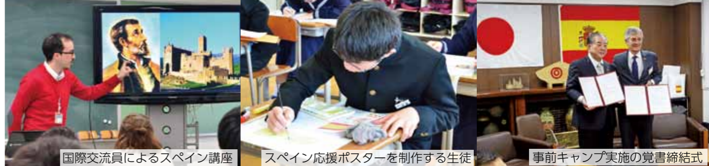
国際交流員によるスペイン講座