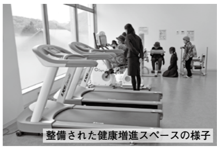
整備された健康増進スペースの様子

増設整備を進めていた阿東保健センターが完成し、11月22日(金)に地元関係者等を招いて落成記念式典を開催しました。