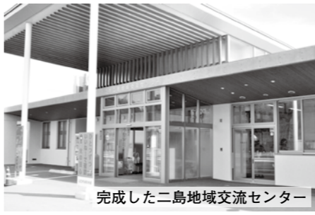
完成した二島地域交流センター

本施設は、鉄筋コンクリート造の地下一階、地上一階の建物で、地階部分の空間を有効利用する、地域交流センターとしては初の「ピロティ様式」を採用した建物です。施設の内部には吹き抜けを設け、自然の光を多く取り入れることで、明るさと温かみを感じることができ、バルコニーからは、秋穂・二島地域の自然豊かな景観を眺望できます。