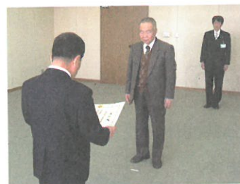
〈総務大臣表彰受賞伝達式〉