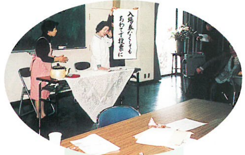
《きんもくせい」の会の寸劇》

今後とも、50周年を節目として、地道に明るく正しい選挙の推進を志し、各活動を基にして、着実に歩を進めたいと考えています。