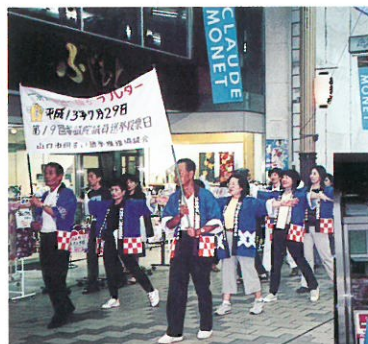
《山口祇園祭総おどりに参加》