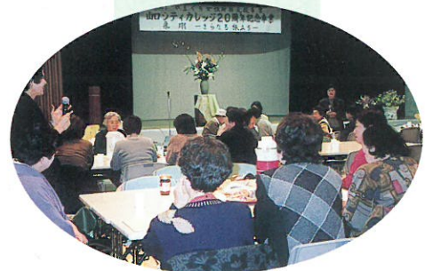
《山口シティカレッジ20周年記念事業》