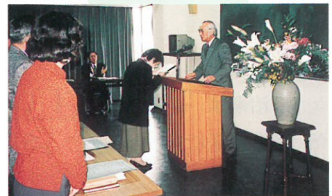
《山口シティカレッジの修了式》