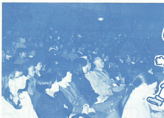
(S63. 1. 27公開講座「性と生を考える」)