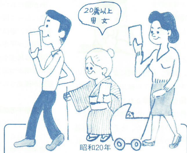
昭和20年 完全普通選挙の時代