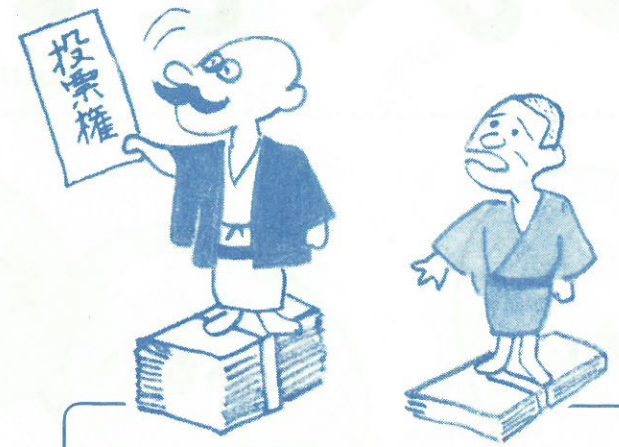
明治22年～大正14年迄 「納税額の多少による差別選挙」の時代