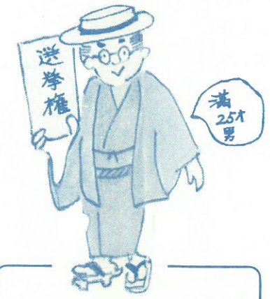
大正14年～昭和20年 男子普通選挙の時代