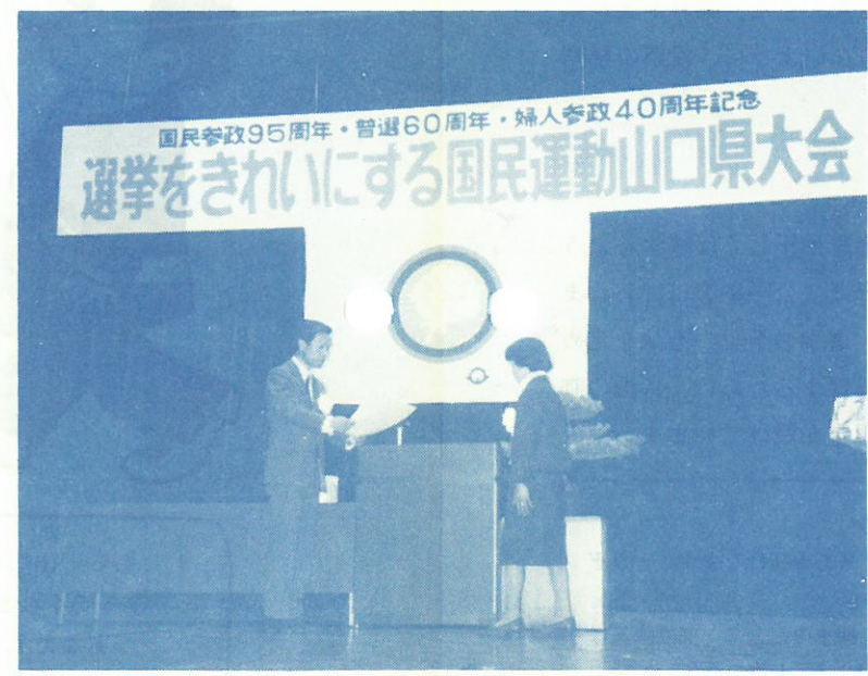
11月12日選挙をきれいにする国民運動山口県大会で、山口市婦人大学講座運営委員会が表彰をうけました。

私をはじめ投票したのは戦時中のことです。 投票所で投票管理者や立会人の前で、私の最も尊敬し信頼できて私たちのためになる候補者1人の氏名を記載して投函したことを今もはっきり記憶しています。 「普通選挙法」が公布されたのは、大正14年5月で今年丁度60周年にあたり意義深い年です。 当時は、選挙権は25才以上の男子に、被選挙権は30才以上の男子にのみ与えられました。 その頃、叫ばれていた選挙粛正運動は、金銭に動かされない明るい選挙を進めている明正選挙運動と全く同じです。選挙で誰れを選ぶかは、各人の自由ですが、私たちの、代りになって政治をしてくださる人を選ぶことが大切なことです。 (F生)