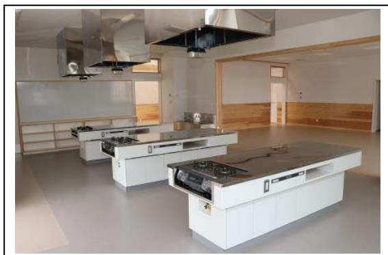
(調理室及び研修室)