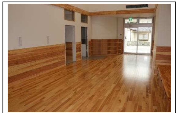
(サブエントランス)