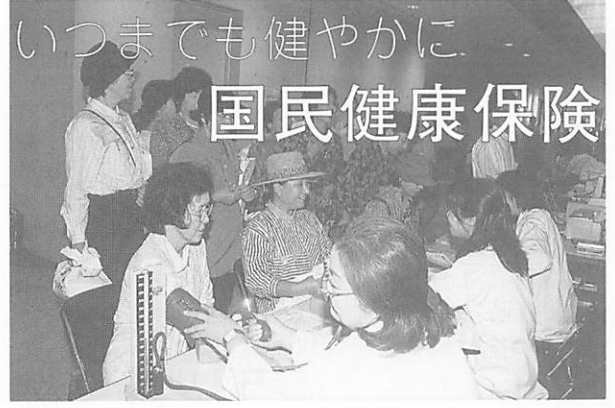
いつまでも健やかに 国民健康保険