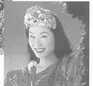
「オールスターものまね王座決定戦」(フジテレビ)でおなじみの中島マリ