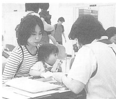
1歳6か月児健康診査