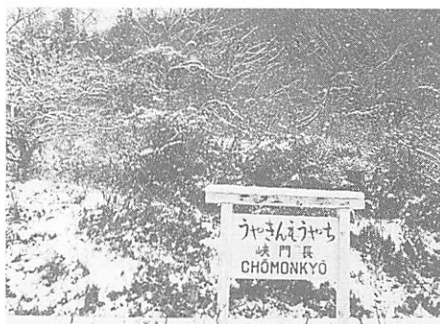
「JR山口線・長門峡駅」(写真展から)