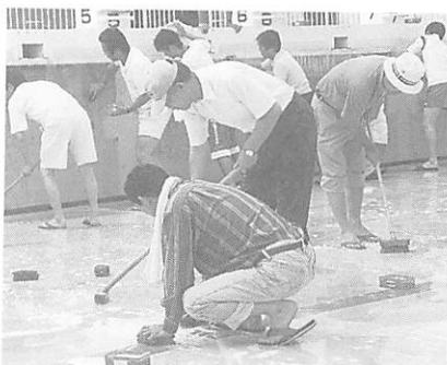
山口ライオンズクラブのみなさんによる清掃奉仕(昨年)

※水泳帽を着用し、サンオイル等は使用しないでください。監視員の指示に従ってください。