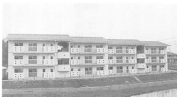
中堅所得者層を対象とした、市内初の特定公共賃貸住宅となる「佐山住宅」