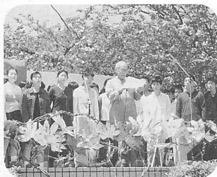
昨年の『空の下の朗読会』