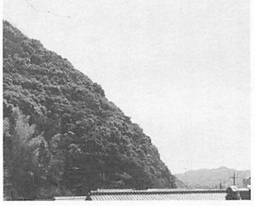
急傾斜地等 (傾斜度が30度以上ある土地)

最近、全国的にがけ崩れ災害が頻発し、大きな被害を被っています。今後、がけ崩れ災害防止に万全を期すため、5月中旬から7月下旬の間、急傾斜地崩壊危険箇所等の再点検を行います。そこで、斜面の状況を調査するため、身分証を携帯した調査員が私有地へ立ち入る場合があります。ご協力をお願いします。 ◇問い合わせ 市土木課 (☎934-2837)