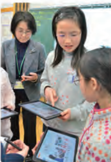
ICT機器を活用した授業風景

タブレット端末の導入、情報教育専門員・支援員の配置など、小中学校のICT教育の環境づくりを進めています。