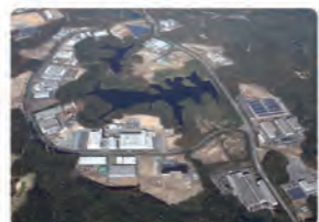
山口テクノパーク