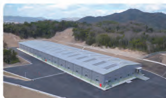
山口市大浦一般廃棄物最終処分場