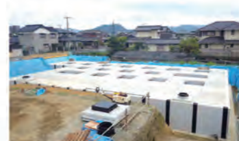
赤妻1号雨水貯留施設(施工中)