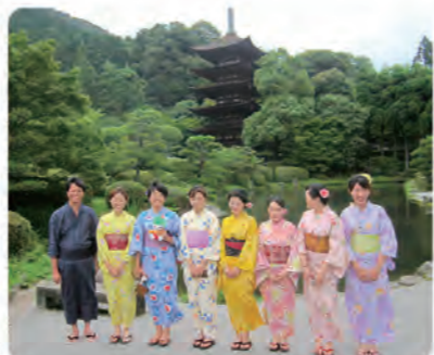
山口市インバウンド観光大使