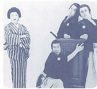
東京ヴォードヴィルショー

し7000円など発売中 劇団東京ヴォードヴィルショー 「竜馬の妻とその夫と愛人」