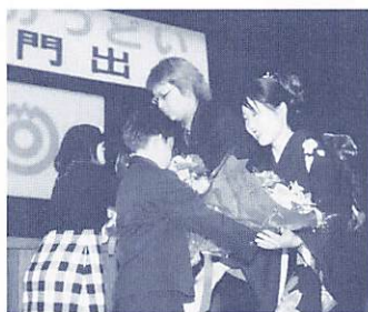
今年の新成人のつどい

なお、他市町村に住居登録がある人で、山口市の新成人のつどいに参加希望の人は、市生涯学習課(☎934-2866)へご連絡ください。