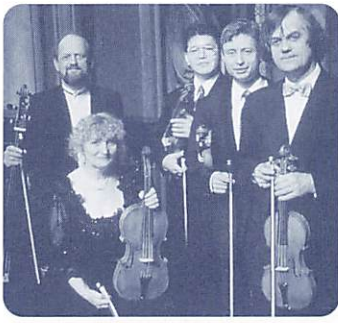
クイケン・クインテット