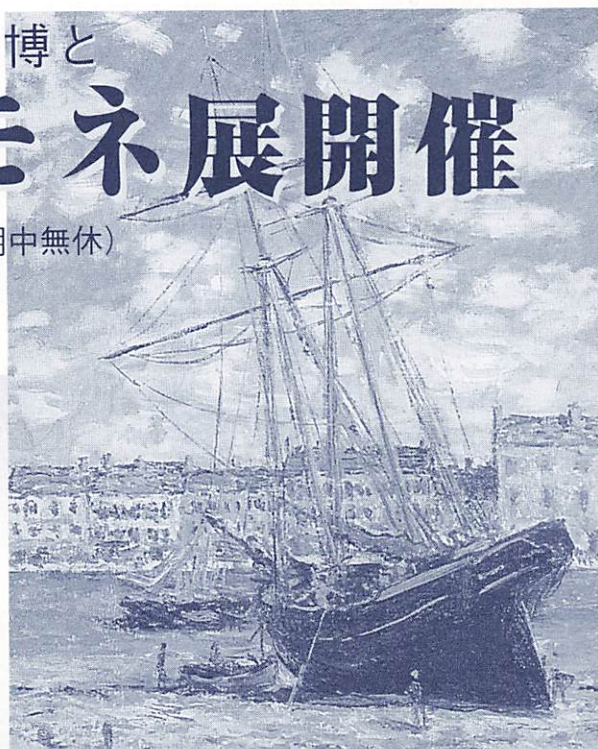
右 海辺の船 1881 東京富士美術館(8月27日まで) 左 プティ・タイユの小道、ヴァランジェヴィル 1882 個人蔵(フランス)