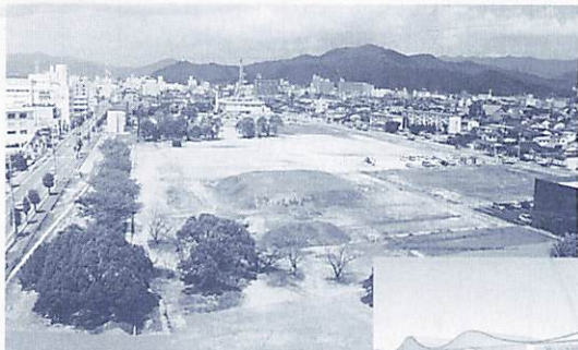
▲山口情報芸術センター建設 予定地(中園町)