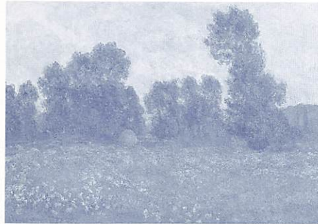
ジュエルニーの草原 1890 福島県立美術館蔵

この度、8月28日から、新たに4点の作品が展示されました。まだご覧になっていない方はもちろん、既にご覧になった