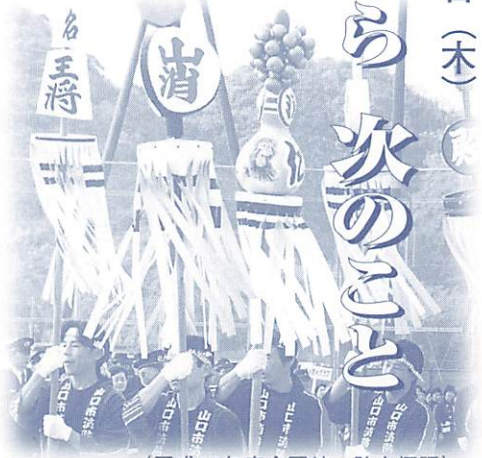
(平成13年度全国統一防火標語)