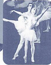
レニングラード国立バレエ