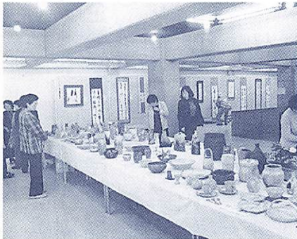
昨年の展示の様子