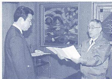
森脇組合長（右）から寄附を受ける合志市長

12月24日、樫野川漁業協同組合から、同組合の設立50周年を記念して、自然環境保護事業等にと、200万円の寄附がありました。多額の寄附に感謝するとともに、寄附の趣旨に添い、樫野川等の自然環境の保全に努めてまいります。