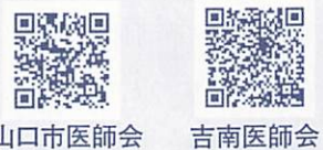
山口市医師会 吉南医師会