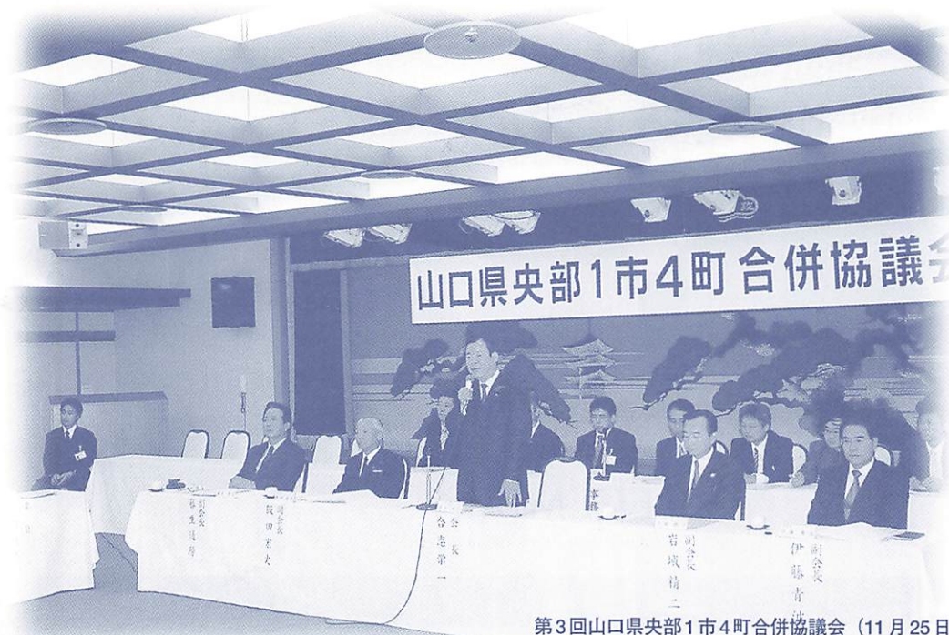
第3回山口県央部1市4町合併協議会（11月25日）

合併に必要な42協定項目については、9月30日（木）に行われた第2回1市4町合併協議会において、新市建設計画を除く41項目について確認が終了していました。また、1市4町合併後の新市建設計画（新県都のまちづくり計画（案））については、10月から11月にかけて各市町によって住民説明会を行い、意見等を計画に反映させた形で、最終的に合併協議会に諮ることとされていました。