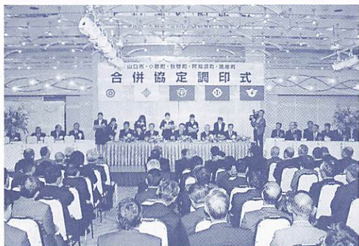
市内ホテルで行われた合併協定調印式 (11月25日)

山口県中部1市4町合併については、これまで2回の協議会において、42合併協定項目のうち、新市建設計画(新県都のまちづくり計画(案))を除くすべての協議が終了していました。 11月25日(木)の第3回協議会では、残る新市建設計画についての最終協議が行われ、全会一致で計画案を確認しました。 これによって、合併に必要なすべての協議が終了したことから、来年10月1日の新市誕生に向け、合併協定調印式が同日行われました。 今後は各市町議会の議決を経て、合併特例法期限内(平成17年3月31日)に県知事に申請し、県議会議決の後、平成17年10月1日の新市誕生を目指すこととなります。