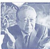
山崎正和氏 (東亜大学学長、 劇作家)

講演とパネルディスカッションを行い、センターに求められる役割や、今後の可能性について議論を深め、「市民のみなさんとともに成長していく施設」としての未来像を描き出します。