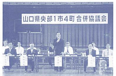
最後の合併協議会に臨む1市4町の各首長

現在の1市4町の役所・役場をそれぞれ総合支所とし、部長職の総合支所長を配置。本庁各部署の機能に対応した各課および分室（市民課、経済課、建設課、出納室分室等）を設置（山