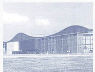
山口情報芸術センター