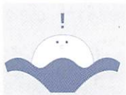
中央図書館のイメージキャラクター「ボンビー」

年末年始の休館に伴い、12月14日(水)からの貸し出しの返却期限が、1月5日(木)以降となりますので、ご注意ください。なお、山口情報芸術センターと山口地域の各公民館(白石を除く)に備え付けの「本の返却ポスト」も、12月28日(水)から1月4日(水)の間、本の受け入れをお休みさせていただきます。1月5日以降にご返却ください。ご協力よろしくお祈いします。