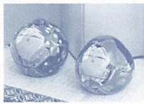
今年度受講生の作品