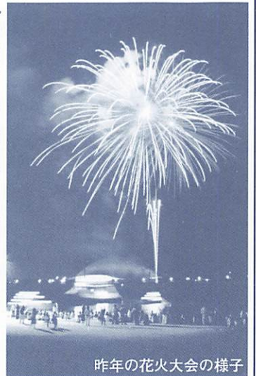
昨年の花火大会の様子