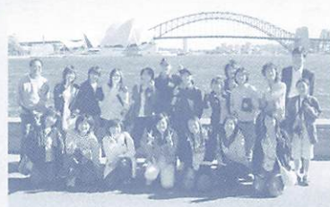
平成17年度ジュニアホームステイ訪問団員