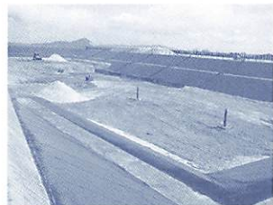
埋立物が砂状に処理されている岩国市日の出町最終処分場

8月11日、今年度第1回目の山口市環境審議会が開催され、「山口市にふさわしく環境への負荷が少ない、一般廃棄物最終処分場の施設・設備のあり方」について、市長が諮問しました。続いて、市から一般廃棄物最終処分場の整備に関して、「これまでは設置場所ありきで進めてきたが、循環型社会形成に伴い、施設・設備について審議することが重要と判断した。最終処分場は、地域の環境保全施設の一つであり、最終処分場があつて始めて循環型システムが完成する」などの説明を行いました。さらに、現時点で想定している次期一般廃棄物処分場の計画概要や先進施設である岩国市の「日の出町最終処分場」の事例などを紹介しました。委員からは、「処分場へはどのようなも