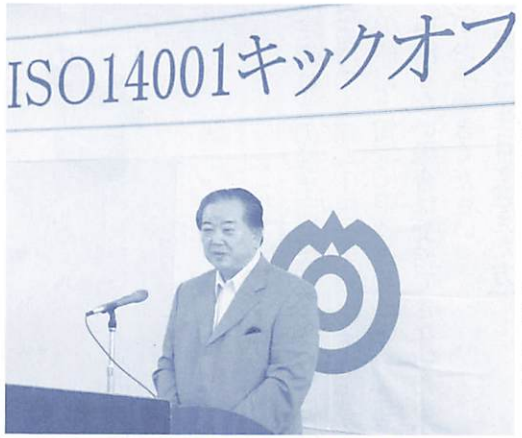
「キックオフ宣言」を行う市長

お知らせ 1 講座 5 図書 7 文化 7 イベント 9 子育て 12 健康 12