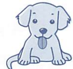
■犬・猫の引き取り日

多くの方に解決の糸口を得てもらおうと、相談内容は初めてのものに限りません。詳しい書類(登記・契約関係の書類)があれば、持参してください。