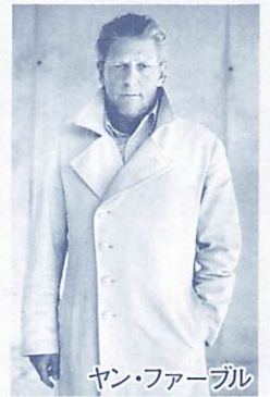
ヤン・ファーブル

演劇やオペラの演出、振り付けの ほか、絵画や造形など幅広い分野 で活躍する前衛アーティストヤン・ ファーブル。本公演では、現代芸術 の巨星 アンディー・ウォーホルが 銃撃を受けたエピソードから着想 を得た「不滅と死」のイメージを、 天使と美しい悪魔の対話に見立て、 映像とダンスで表現します。 各公演限定100席につき、チケッ トはお早めに！