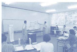
前回の公開プレゼンテーションの様子

【申請】9月30日(水)までに、備え付けの様式で、直接市協働推進課(山口総合支所 ☎083・934・29)の様に、各総合支所自治