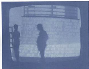
参考写真: Semitra「フラッシュを使用しない撮影は許可されています。」(2008)

卓越した感性とメディア技術を発揮する「セミトラ」の初の個展「Font/Time」。「フォント」(文字書体)における「時間」をテーマに、時間によってフォントが変容していくユニークなアイデアの新作を発表します。展示空間だけではなく、ウェブサイトからも観客が参加で