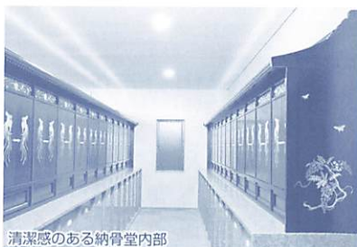
清潔感のある納骨堂内部