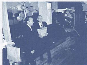
昨年度の総会の様子

現在の会員数は約250人を数え、会員には、市報等のふるさとの便りを定期的に送付し、ふるさとの近況をお知らせするほか、夏には定時会員総会・懇親会、春と秋には会員交流会等のイベントを開催し、会員同士や「ふるさと山口市」との交流を図っています。