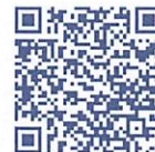
防災メール QRコード