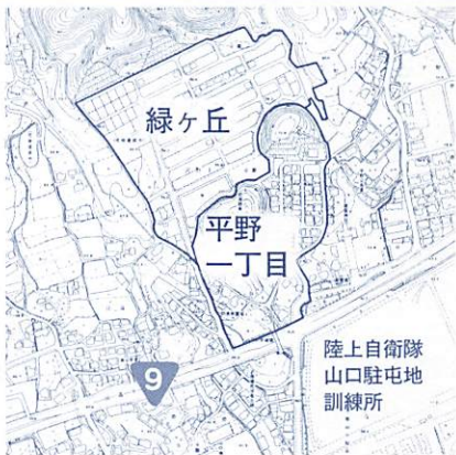
【宮野地域】緑ヶ丘、平野一丁目