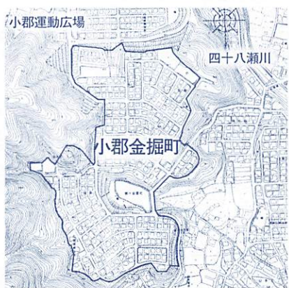
【小郡地域】小郡金堀町