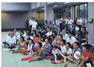
8月3日に行われた 松美柔道スポーツ少年 団による試合観戦会の 様子

次のリオ（2016年リオデ ジャネイロオリンピック）を目指 して日々精進していきますので、 これからも応援していただける と幸いです。