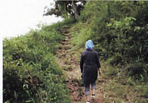
山道が続くので足元に注意

中継放送所を過ぎると景色は一転して「登山」モードにスイッチ。途中の休憩所付近では、眼下に中心市街地が箱庭のように広がる景色を眺めることができます。(右上写真)