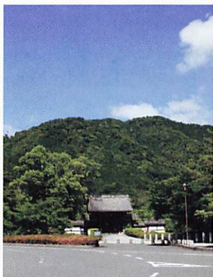
藩庁門（県庁前）の西方に位置する鴻ノ峰