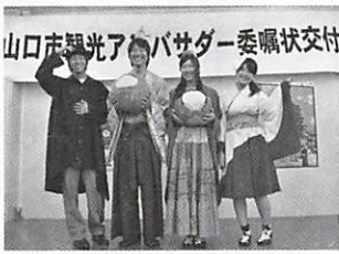
山口市観光アンバサダー委嘱状交付式に参加した4人が、さっそく本市の魅力

市では、山口大学の協力により、観光を学ぶ大学生6人を、本市の観光をPRする「市観光アンバサダー（大使）」に委嘱し、7月12日、山口総合支所で委嘱状交付式を開催しました。