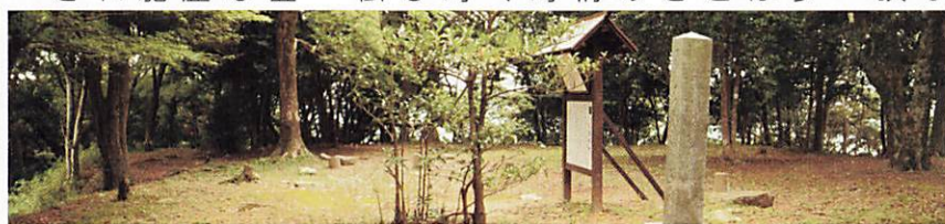
山頂の風景。高嶺城の全景図などを記す説明板が設置されている

山頂は木立が多く、開放的な眺望は臨みませんが、ここは本丸があったとされる場所。毛利軍の侵襲に備えて城を構えるも、見込んだ時期より毛利軍が早く侵入し、迎え撃つ時点で城は未だ完成していなかったとの伝えもあります。静かな山頂は、登頂の充実感だけでなく、先人の苦労や歴史の重みに思いを馳せながら、時の流れを感じる事ができる空間でした。