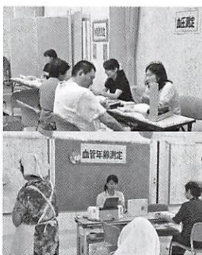
昨年度 健康チェックの様子 上) 血圧・体脂肪測定 下) 血管年齢測定