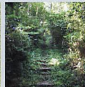
中腹まで階段状の道が続く