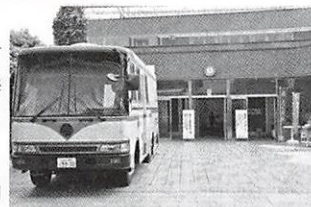
メイン会場で実施します

40歳以上の市民の方が対象です。(受診ハガキを持参してください) 同時に大腸がん集団検診、休日複合検診の事前予約を受け付けます。