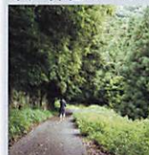
舗装された道は勾配も緩やか