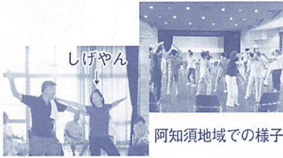
阿知須地域での様子

この企画では、赤れんがから外へ飛び出して、市内各地でワークショップも行っています。一緒に体を使って表現し、ダンスを作っていくことで、参加者同士のつながりも深まっています。