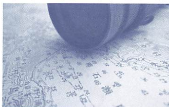
実際に使われていた海図

【申込】阿知須「いぐらの館」(阿 知須3425 ☎ 0836・65・ 2403)