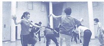
6月開催のワークショップの様子

申込 郵送、FAX、Eメールのいずれかで、〒住所、氏名、年齢、電話番号、学校名・学年または職業を明記の上、C・S赤れんが