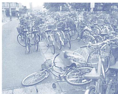
駐輪場の様子。路上にはみ出して止められた自転車によって、歩行者や車が通行しにくく、危険な状態です。

駅の駐輪場は、利用者のみなさんに自転車を整理して止めてもらうことで、自転車と組み合わせた公共交通利用の利便性の向上を図り、また、駅周辺の景観を美しく保つために設置しています。 しかし、駐輪場によっては、駐輪スペースに空きがあるにもかかわらず、路上に駐輪された自転車により、歩行者や自動車の通行の妨げになるばかりでなく、緊急時に救急車や消防車などが通行できない状況が発生するおそれがあります。