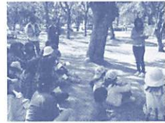
ネイチャーゲームの様子

ネイチャーゲームは、五感を通して、自然の不思議や仕組みを学ぶことができるゲームです。ゲームを体験して、地球温暖化防止のために私たちができることを一緒に考えましょう。