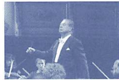
ラファエル・フリューベック・デ・ブルゴス氏

140年余の歴史を誇る同楽団は、チャイコフスキー、ドヴォルザーク、ブラームスなどの大作曲家が自作を演奏した歴史を持つドイツの名門オーケストラで、常に優れた首席指揮者を擁し、世界的名声を誇るソリストと共演を続けています。